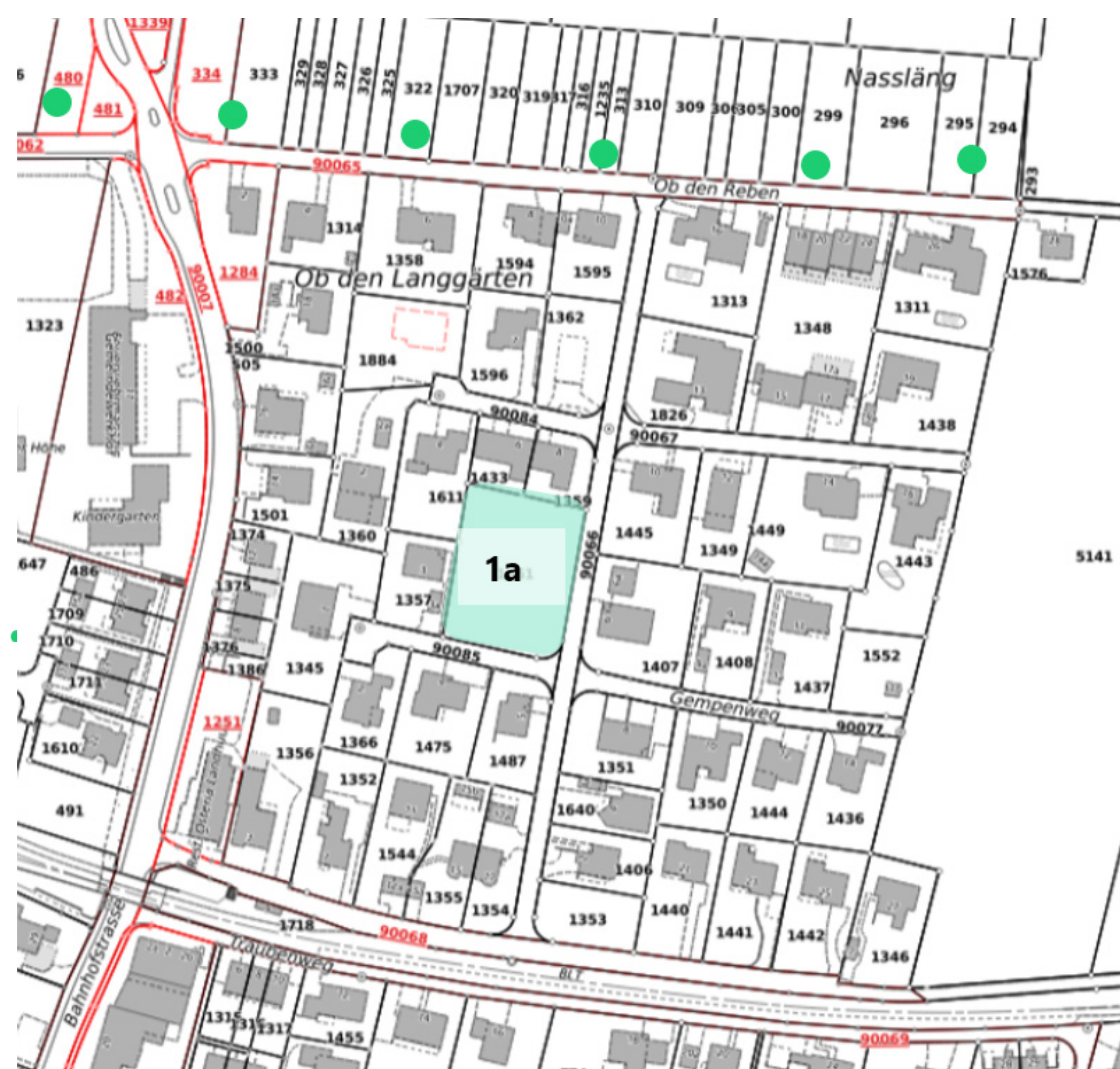
Strategie für die Nutzungsplanung Ob den Reben und Ob den Langgärten: Mindestdichte und Übergänge