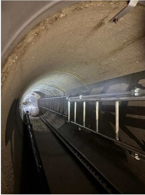
Blick in die Brunnstube (8 Meter), Fassung