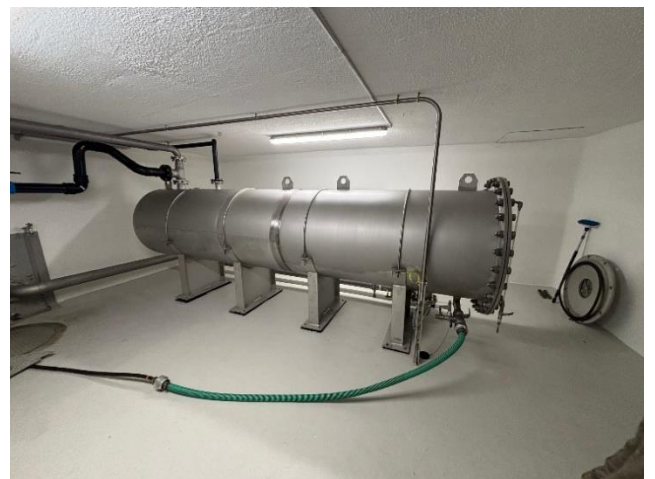
3000 Liter Reinwassertank

Vielen Dank an die Firma Heinis AG für diesen eindrücklichen Einblick in die Technik, die Infrastruktur sowie die Funktion unserer Wasserversorgung.