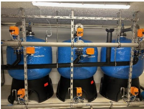
Arsen Filter Anlage Bättwilerstrasse 7 a