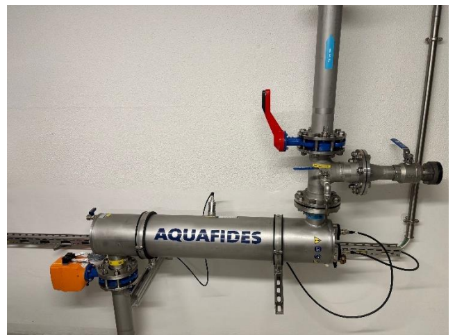
UV C Filteranlage Bättwilerstrasse 7 a