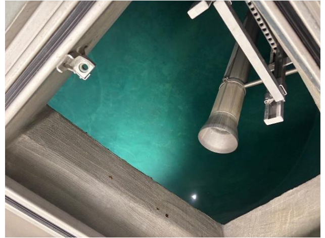
Blick in das Reservoir mit Ueberlauf