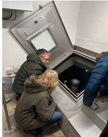
Einstieg zum Wassertank des Reservoir

Das Reservoir wird durch die Quelle und über die Pumpstation im Bättwilerstrasse 7 a über eine Leitung befüllt. Das Reservoir liefert ca 80% des gesamthaft benötigten Wasserbedarfs. Die restlichen 20 % werden vom WHL (Wasserverbund hinteres Leimental) bezogen. Unser Reservoir ist mit dem WHL, Reservoir verbunden, somit besteht eine Redundanz.