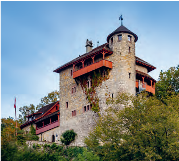
Jugendherberge Mariastein Burg Rotberg

Weitere kulturelle Anlässe sind auf den Gemeindefseiten und in den Dorfpublikationen zu finden.